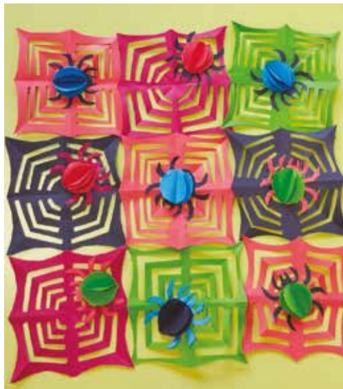
Bellefois, Halloween 2025